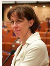
Fabienne KELLER Sénatrice du Bas-Rhin Conseillère municipale et communautaire de Strasbourg